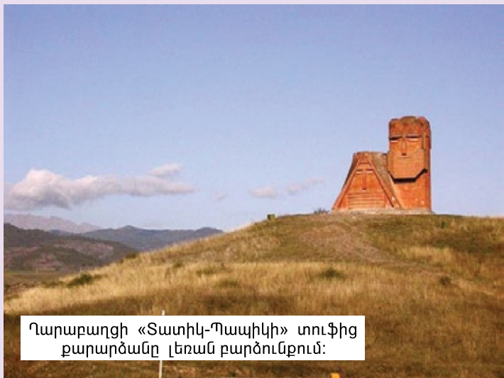
Ղարաբաղցի «Տատիկ-Պապիկի» տուֆից քարարծանը լեռան բարձունքում:

- Մի երիտասարդ Արցախցի, դպրոցն ավարտելուց հետո, ընդունվում է Սանկտ-Պետերբուրգի համալսարանը, ավարտում է, աշխատում, տարիների ընթացքում մեծ գումար է վաստակում և վերադառնում է հայրենի երկիր՝ Ղարաբաղ: Այնուհետև՝ իր միջոցներով բարեկարգում է հարազատ քաղաք-Շուշին. կառուցում է երեխաների համար խաղահրապարակներ,