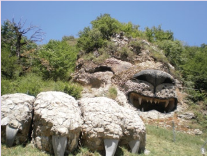
Հսկայական քարանձավը, որ հետաքրքիր լուծումներով դարձել է «Մռնչացող առյուծ»: Ի դեպ, այդտեղ լուսանկարվել է նաև մեր մեծ հայրենակից և բարերար ֆրանսահայ Շառլ Անձնավուրը: