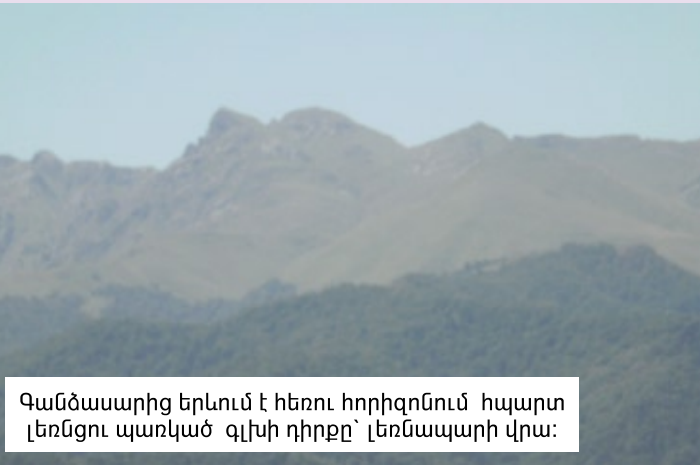
Գանձասարից երևում է հեռու հորիզոնում հպարտ լեռնցու պառկած գլխի դիրքը՝ լեռնապարի վրա:

Ասում են, որ տարիներ շարունակ տարբեր դարերի գավթիչներ, այս հպարտ լեռնաշխարհում, Ղարաբաղի անտառապատ լեռներում, միշտ փնտրել են գանձեր: Իսկ լեռներից մեկի բարձունքում, 1215 թվականին, հայ իշխան Հասան Ջալալը՝ /կան Ջալալյանը, թեև անուն-ազգանունը արաբական է/ կառուցում Գանձասարի եկեղեցին: Ջավթիչները բռնում են նրան և ստիպում, որ ասի գանձերի տեղը: Հանում են այքերը, կտրում են ձեռքերը, տանջամահ են անում, իսկ նա վերջին շնչում ասում է.