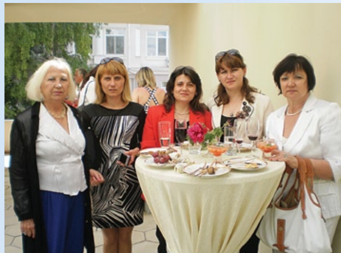
Мероприятия, организованные болгарской общиной Одессы