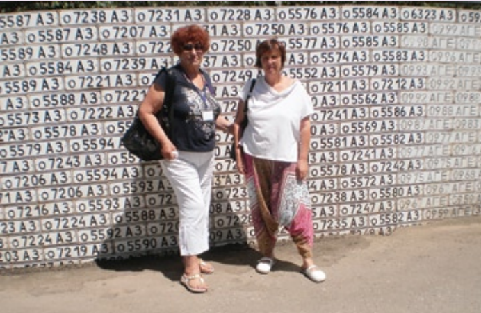
Ադրբեջանական ավտոհամարանիշերով հուշցանկապատը՝ Շուշիում: