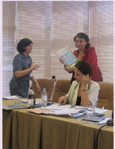
Яркие моменты фестиваля с участием делегации Союза армян Украины.

Հետաքրքիր պահեր «մեկ ազգ, մեկ մշակույթ» փառատոնի օրերից: