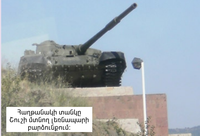
Հաղթանակի տանկը Շուշի մտնող լեռնապարի բարձունքում:

Շուշիի ազատագրման օրը՝ մայիսի 8-ին, Գագիկ Ասլանյանի տանկը առաջինը մտավ հինավուրց հայկական այդ քաղաքը: Ազերների դեմ դժվարին պայքարում, տանկի անձնակազմը զոհվեց, իսկ տանկի հրամանատար Գագիկ Ասլանյանի զույգ