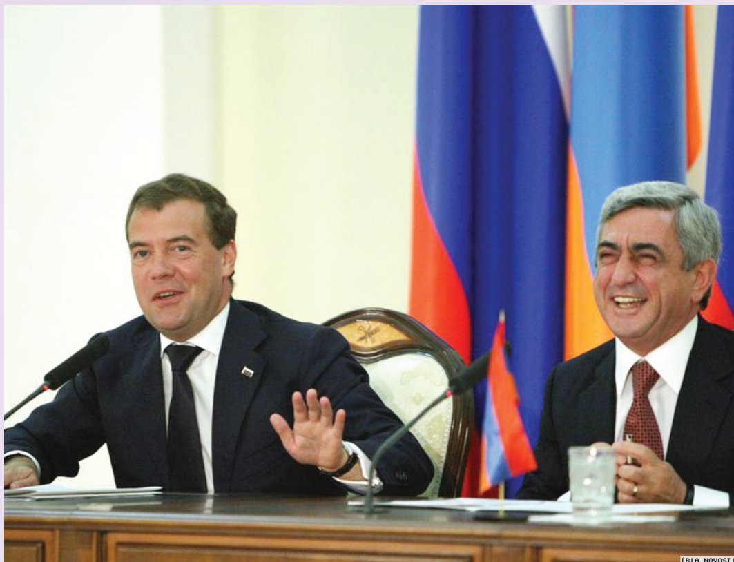
Президент Вірменії Серж Саргсян та президент Росії Дмитро Медведєв під час офіційної зустрічі в Єревані

Вірменські урядовці пов'язують необхідність російської посиленої присутності з невирішеною проблемою Нагірного Карабаху, сепаратистського регіону Азербайджану, населення якого становлять місцеві вірмени. Внаслідок шестилітньої війни постала самозвана незалежна країна, яка де-юре залишається частиною Азербайджану, а решта світу зараховує Нагірний Карабах до так званих