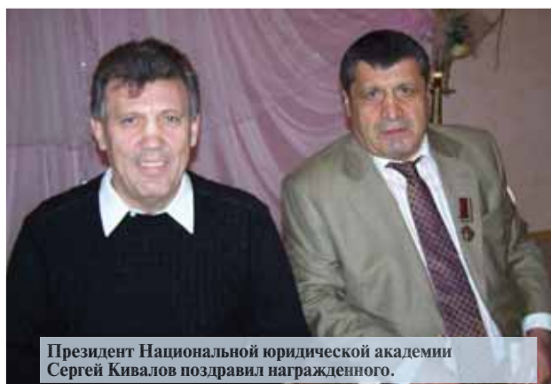
Президент Национальной юридической академии Сергей Кивалов поздравил награжденного.

в четыре тысячи квадратных метров. Теперь это крупнейший армянский культурный центр в Восточной Европе. К услугам посетителей – спортзал, фитнес-клуб, концертный зал на 420 мест, зал для торжественных церемоний на 200 мест. Второй этаж полностью отведен под школу-восьмилетку. Теперь здесь занимается 120 учеников. «Мы открыты для всех и хотим, чтобы здесь занимались не только армяне,