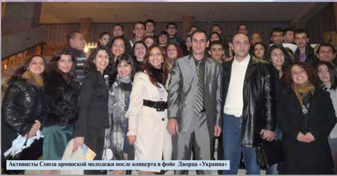
Активисты Союза армянской молодежи после концерта в фойе Дворца «Украина»