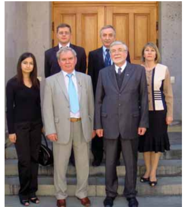
Делегация Донецкого национального университета в гостях у Ереванского государственного университета

Встречи, проходившие как в формальной, так и в неформальной обстановке в рамках торжества, оказались плодотворными для обеих сторон. Они еще раз подчеркнули статус деловых отношений между партнерами: конструктивный диалог по вопросам договора о международном сотрудничестве на уровне университетов. В ходе встреч было принято решение по расширению сфер сотрудничества, именно привлечению юридического и других факультетов к программе по укреплению внешнеэкономических связей между Ереванским государственным уни-