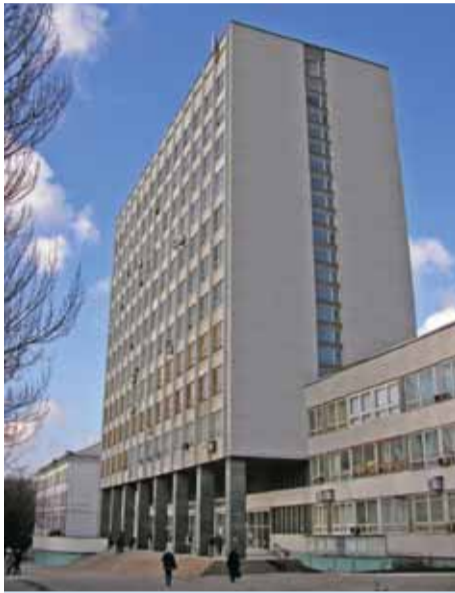
Здание Донецкого национального университета

Этого торжества величия образования, науки и культуры с нетерпением ожидали тысячи студентов и сотни преподавателей элитного вуза Армении – Ереванского государственного университета. Ему – 90! Именно столько прошло с момента, когда 16 мая 1919 года он стал на путь развития и процветания своей республики. За плечами почти век, а жизнь все так же бьет ключом!