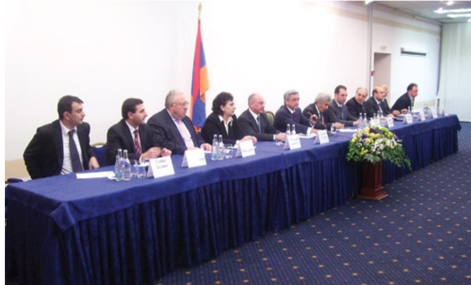
Հայաստանի Հանրապետության Մեծարգո նախագահ պարոն Սերժ Սարգսյան, Գերաշնորհ Սրբազան եղբայրներ, Հարգելի նախագահություն, Հարգարժան մասնակիցներ այս համախմբման,

Հայաստանի Հանրապետության նախագահի համահայկական շրջայցի և սույն համախմբման մասին Դոնի Ռոստովում, թույլ տվեք արտահայտել մի քանի խոհեր: