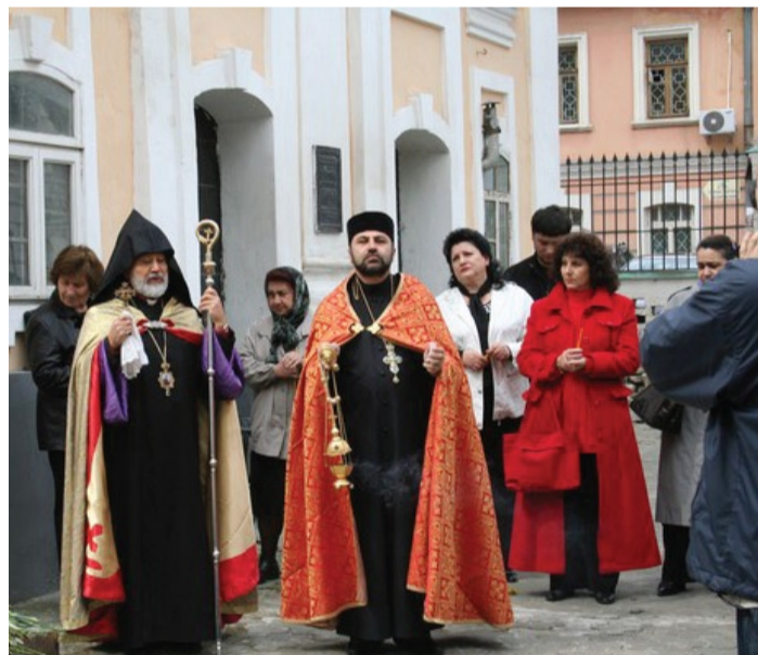
Траурный митинг в Киеве

Геноцид армян в Османской империи с 1915 по 1923 гг. признали более 20 стран, среди которых Аргентина, Бельгия, Ватикан, Венесуэла, Германия, Греция, Канада, Кипр, Ливан, Литва, Нидерланд-