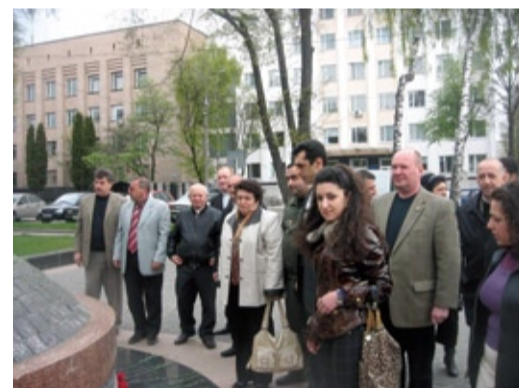
Траурный митинг в Житомире

То, что мы не забываем этот день, означает, что мы не безразличны к жизни тех людей, которые не успели жить, творить, любить. Не безразличны к смерти, которая разрушает все наши надежды и приносит много боли и страданий; и не безразличны к нашей истории, страницы которой иногда написаны кровавыми буквами.