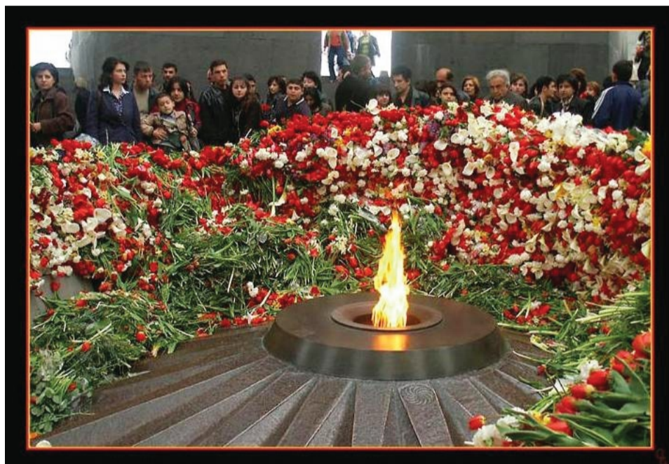
У Вечного огня в Ереване (Цицернакаберд)

В этот день, после возложения цветов к памятнику Хач Кар, в армянской церкви состоялась литургия, посвящённая памяти жертв Геноцида. А одесская областная армянская молодёжная общественная организация «АРМИР» организовала показ документального фильма «Западная Армения», чтоб каждый желающий мог познакомиться с историей, мог увидеть те земли, которые принадлежали нашим предкам. Могли увидеть города и церкви, которые армяне создали на этой земле, те прекрасные творения великих архитекторов и художников.